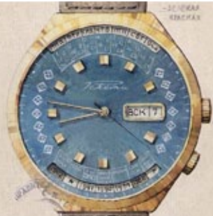
Оригинальная акварель / Original watercolor 1976