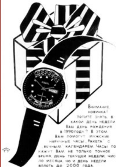
Постер / Poster 1979