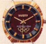
Оригинальная акварель / Original watercolor 1979