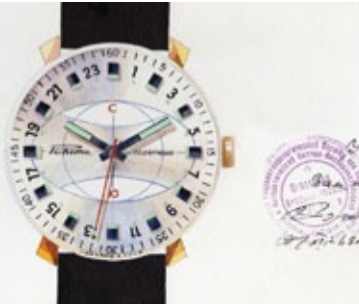
Оригинальная акварель / Original watercolor 1969