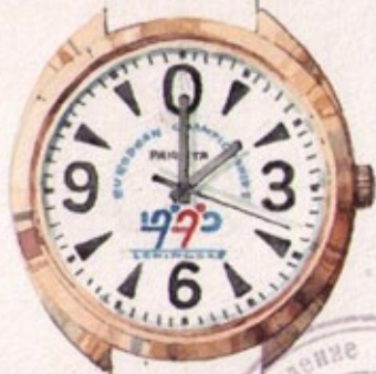
Оригинальная акварель / Original watercolor 1989