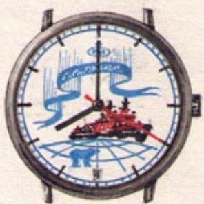
Оригинальная акварель / Original watercolor 1992