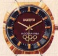
Оригинальная акварель / Original watercolor 1979