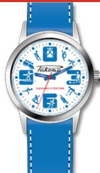
Эскиз часов для Сочи 2014 / Sketch of watches for Sochi 2014