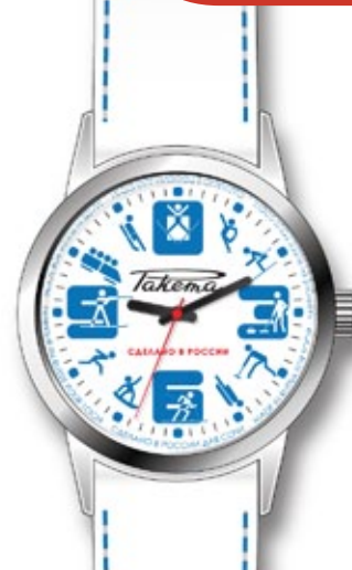
Эскиз часов для Сочи 2014 / Sketch of watches for Sochi 2014