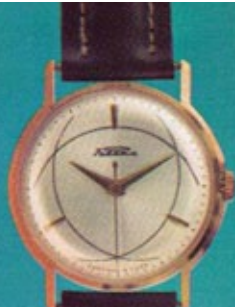
Брошюра / Brochure 1980