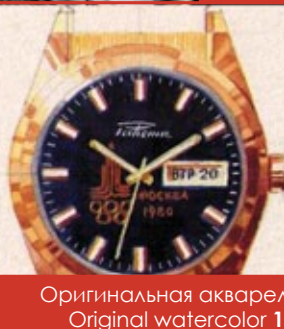
Оригинальная акварель / Original watercolor 1979