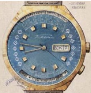
Оригинальная акварель / Original watercolor 1976