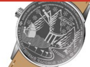
Эскиз правировки для Сочи 2014 / Sketch of an engraving for Sochi 2014