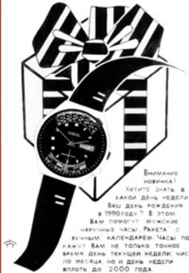
Постер / Poster 1979