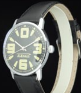
Временная Коллекция / Temporary Collection 2009